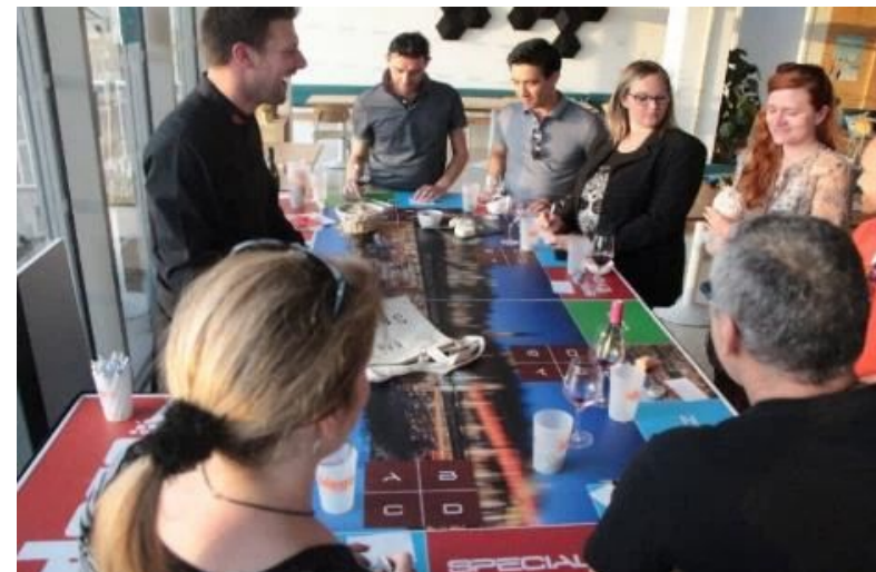
Table des « Vimots » : Analyse visuelle et rapidité seront des atouts majeurs pour grapiller de nombreux viti-jetons !

Table « La Magie des Bulles » : Une découverte ludique pour comprendre comment analyser Champagne et effervescents.