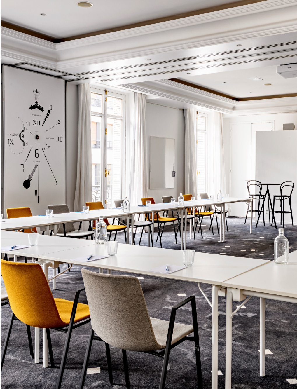
J'explore la galerie